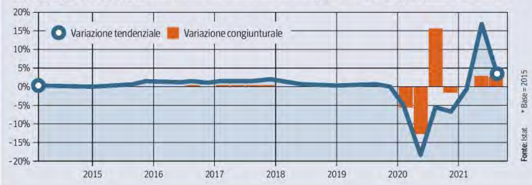
Recovery post Covid Prodotto interno lordo, dati concatenati, destagionalizzati e corretti per gli effetti di calendario*

Ritaglio Stampa ad uso esclusivo del destinatario. Non riproducibile